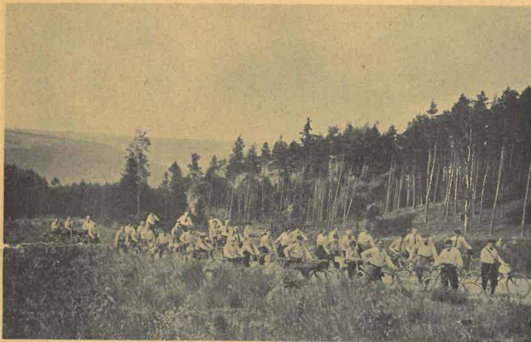
K. C. R. na Křivoklátsku v r. 1924.

Tak v západní části Středohoří, rozkládající se od Loun až k velkolepému Labskému dolu, charakterisované vlnnými kupami různých tvarů a výšek, jichž temena zdobí malebné trosky četných hradů, a oplývající obzvláštěm bohatstvím ovocných sadů, které v opravdový ráj mění rozlehlé doliny, nalezneme do roku jubilejního 18 cílů výletních, k nimž podnikli jsme 39 výletů. Zvláště jsme byli zamilováni do ladného Košťálova a vyhlídkové Sutomské hory s hra-