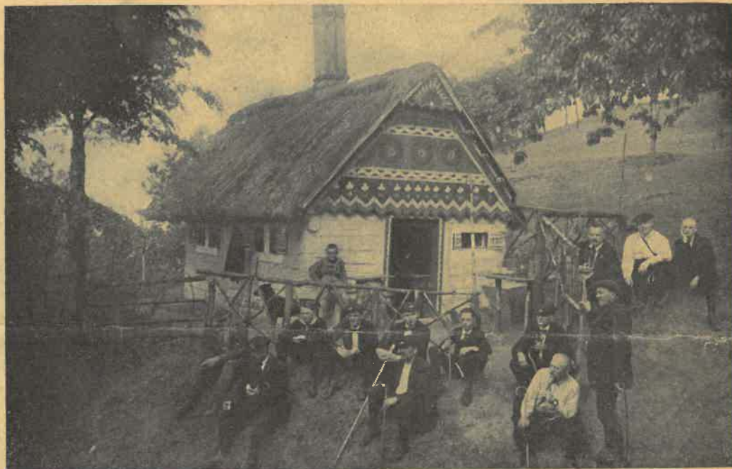
U »Perníkové chaloupy« na Mužském v r. 1922.

Nejskvělejší podnikem byla opětná 14 denní výprava na Slovensko a Vysoké Tatry. Zúčastnilo se jí 6 jezdců a 5 pěších. Svoji turu, jež byla podrobně vylíčena v »Cyklistovi« r. 1926, počali jsme ze Vrútek, průsmykem Kralovanským a Orovským do Istebného a na Oravský zámek, pokračující z Vyšného Kubína do Leštin, na Velký Choč a do Růzomberka. Drahou od Strby, pěšky s koly ku Strbskému a bez kol k Popradskému plesu. Kotlinou Hincových ples na Koprovské Sedlo a štít. Po cestě Svobody do St. Smokovce a pěšky do Slezského domu, Velickou dolinou na Polské sedlo, Malou Vysokou, přes Malý Prielom do Velké Studené Doliny a do hotelu Kamzík. Kolem vodopádů Kolby na Hrebienok, lanovkou do Smokovce a na kolech do Popradu. Přes Vernar do Ledové jeskyně dobsínské, přes Telgart do Muráně a na hrad