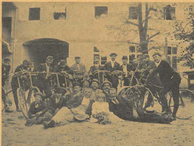
Výletní družina Klubu cyklistů roudnických z let devadesátých.

V dalším roce bylo se klubu spokojiti opět jen silničními závody na trati Lovosice—Roudnice. Kroj změněn tím způsobem, že zavedeny dlouhé hnědé spodky se širokými nohavicemi a modrý, dvouřadový kabát se žlutými knoflíky. Takto vyzdoben jel klub do Velvar na silniční závody, působě všude — jak znamená v knize zápisů — opravdový respekt důstojným chováním, nikoli však »pítím piva z nočníku jako jistí pánové«. Sezona skončena slavnostní vyjížděnkou s lampiony přes Hracholusky na erární silnici