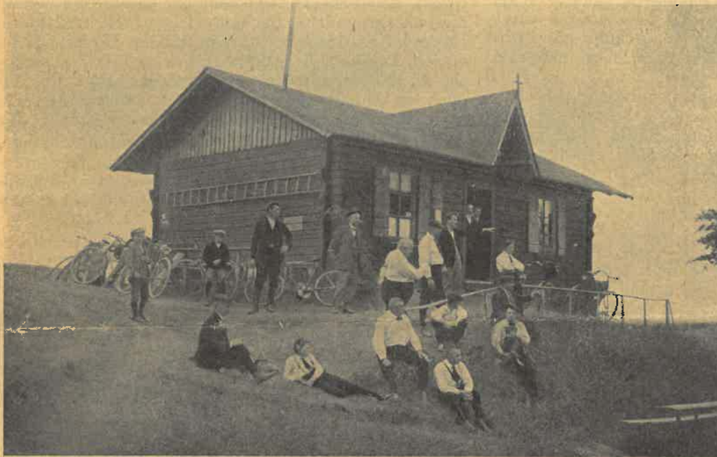
Na Bukové hoře r. 1922.

Druhý byl 10 denní na Vysoký Jeseník a Bezkydy, jehož mimo 14 jezdců zúčastnily se i dvě opěšalé dámy. Podrobně vylíčen byl v »Cyklistovi« r. 1924 v č. 1—5. Zahájivše ho z Ramsové, vystoupili jsme na Šerák, Keprník, Vozkův kámen, Studánkovou planinu a Červený vrch. Pokračující pak velice svízelně po hřebenu ke Švýcárně a minuvše pro špatné počasí Praděd, sjeli jsme od Ovčárny do Karlových Lázní,