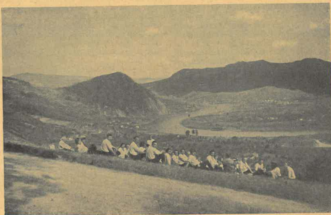
Z okolí Velkého Března.

Jen v horách hledají a také vrchovatou měrou nalézají četné družiny našich kolečkářů čistou, ušlechtilou zábavu, vydainé osvěžení po trampotách všedního života a vůbec veškery ony rajské požitky, jež