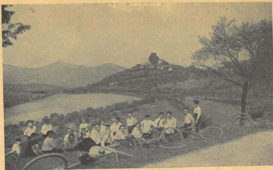
U hradu Kamýku v r. 1926.

měrou bezmeznou zdarma nabízejí se tam všem, kdož mají srdce otevřená pro úžasně krásy vznešené matky přírody. V posvátném nadšení pak v jedno splývajíce s divukrásným okolím, zapomínají na vše-