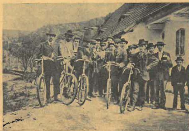
»U krobiana« v údolí Kokořínském v r. 1902.

Velice nás tížil zákaz jízdy na kole v některých ulicích, zejména ulici Komenského. Žádost naše o uvolnění aspoň této důležité ulice byla sice opatrnými otci města zamítnuta, ale zato dostalo se nám cen-