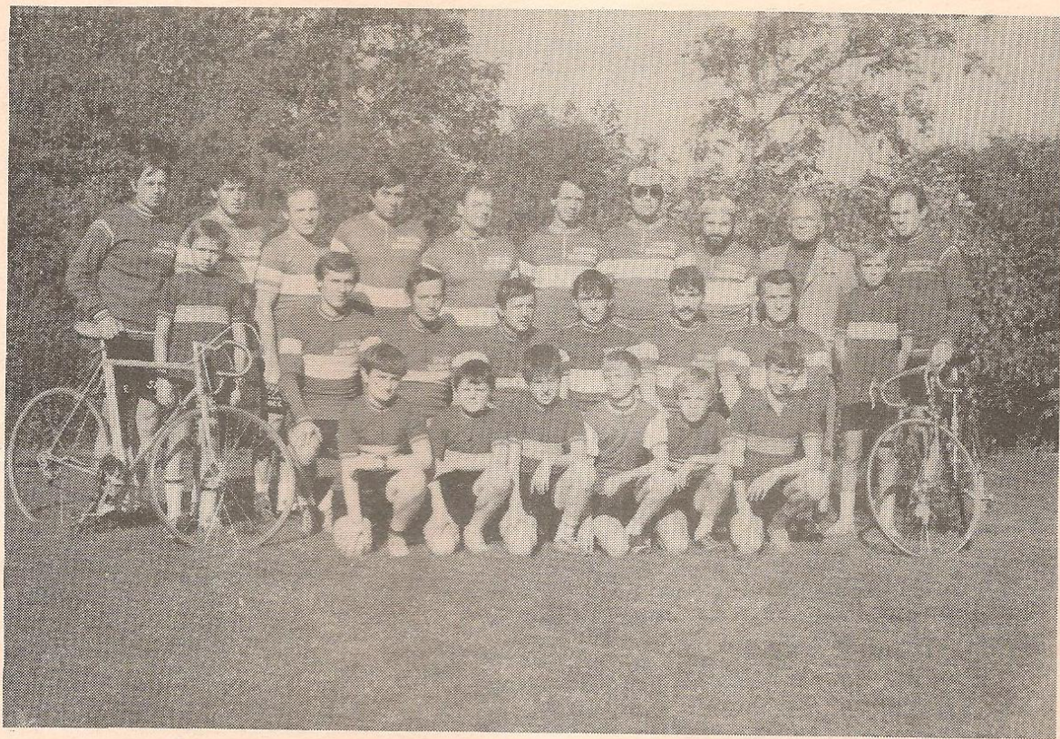
Část cyklistického oddílu v jubilejním roce